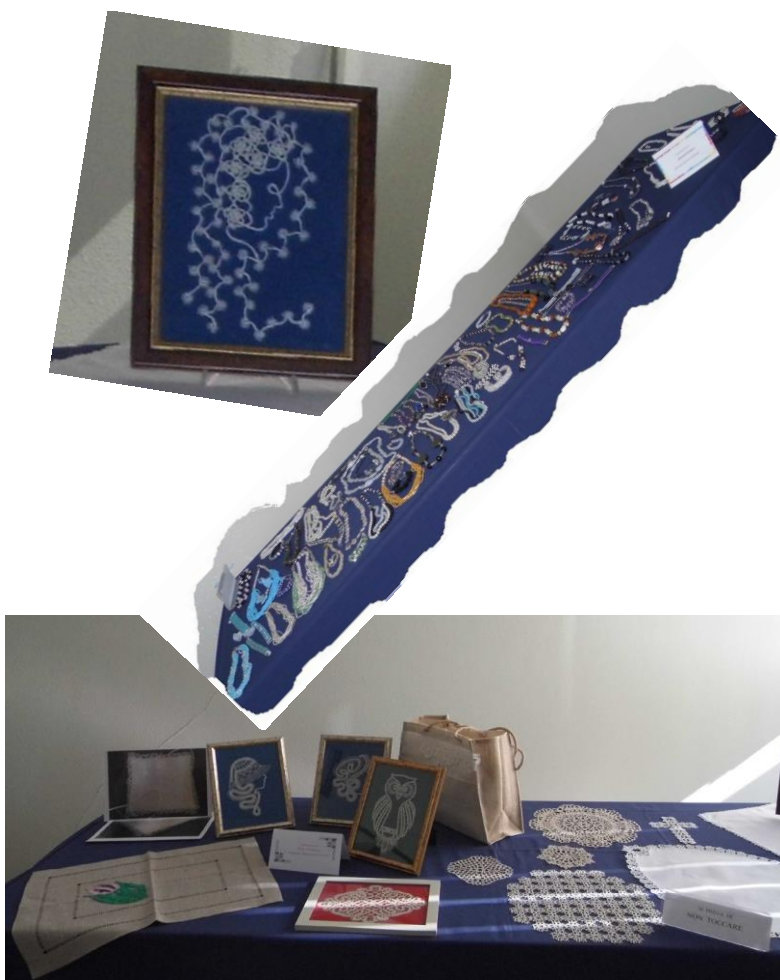
Laboratori di Tombolo, Chiacchierino, Bigiotteria