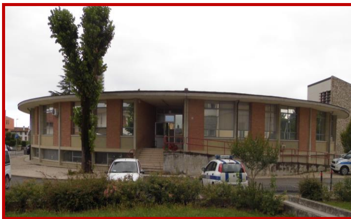
Ex Scuola Elementare di Pesian di Prato, i cui locali ospitano la nostra Associazione.