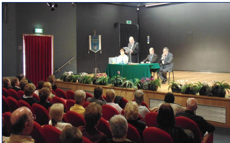
Assemblea del 10° della Fondazione del 29 maggio 2016